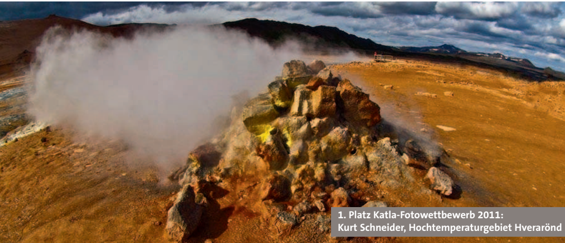
1. Platz Katla-Fotowettbewerb 2011: Kurt Schneider, Hochtemperaturgebiet Hverarönd

Durch Island auf einfachen Hochlandstrecken